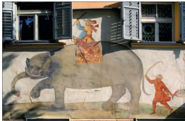
Fresque sur la façade de l'Hôtel «Eléphant» à Bressanone / Tyrol du Sud